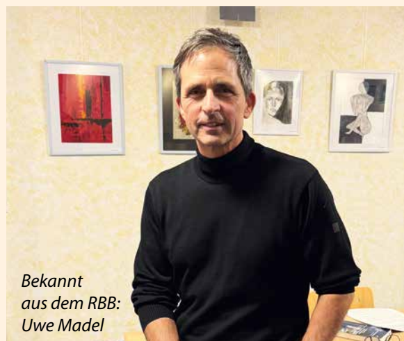
Bekannt aus dem RBB: Uwe Madel