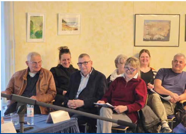
Mitglieder des erneut gewählten Aufsichtsrates