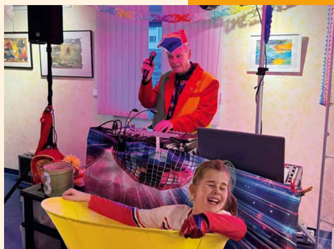
Fröhliche Gesichter bei Jung und Alt beim Kinderfasching