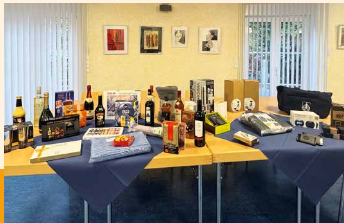
... warteten wieder viele attraktive Gewinne