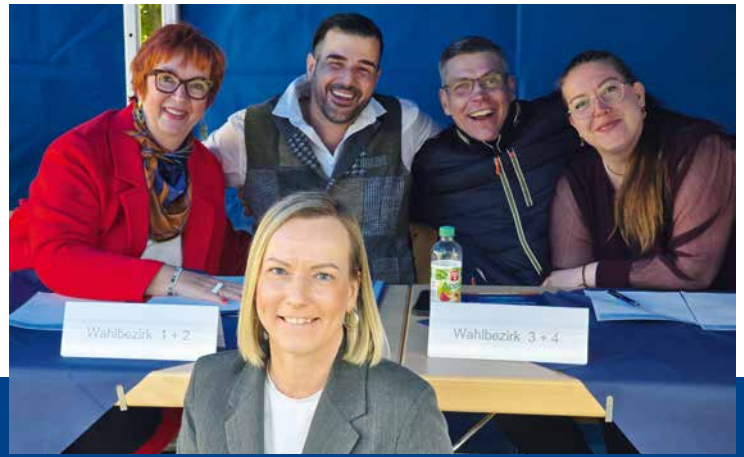
Das Team der Mitgliederbetreuung

am 5. Juni 2026 waren zum Zeitpunkt der Vertreterversammlung bereits abgeschlossen.