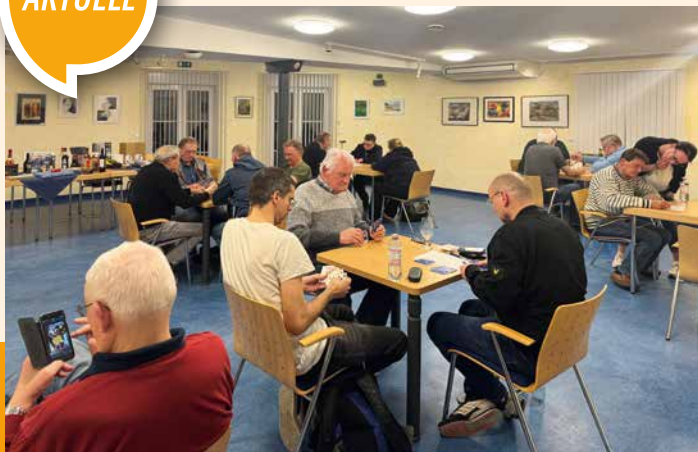
Auf die Teilnehmer des Skatturniers ...