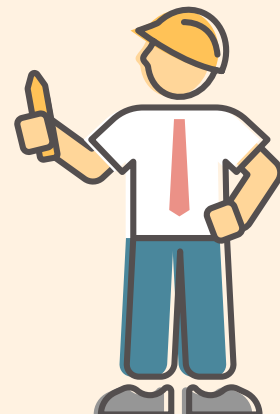
Visualisierung vom Ausbau des Glasfasernetzes im Komponistenviertel

Neben den energetischen Maßnahmen werden in der Schönstraße 48a auch die Stränge und Bäder saniert. Zudem erhält das Gebäude als letztes Objekt unseres Bestandes Balkone. Abschließend werden das Treppenhaus saniert und neue einbruchhemmende Wohnungseingangstüren eingebaut.