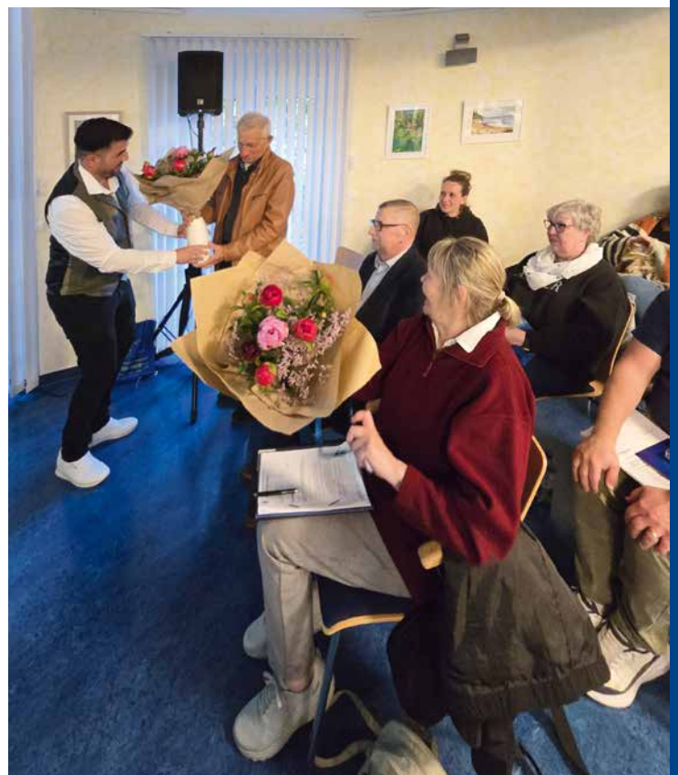
Glückwunsch an die gewählten Kandidaten

Mit dem einstimmigen Votum der Vertreterversammlung wurde der bisherige Kurs der Genossenschaft eindrucksvoll bestätigt. Die Wohnungsgenossenschaft WEISSENSEE eG verfügt weiterhin über eine solide wirtschaftliche Basis und kann ihre Investitionen in Wohnqualität, Nachhaltigkeit und Infrastruktur auch in den kommenden Jahren konsequent fortsetzen.